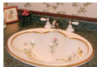
Kohler社の花模様洗面ボウル