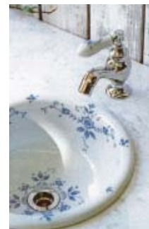
Lavatory 手洗ボウル&水栓金具