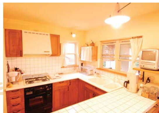
木製キッチン(タイルカウンター)