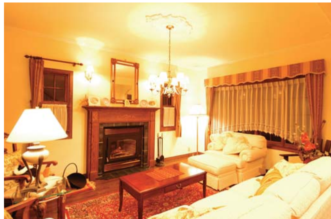
暖炉のあるリビング