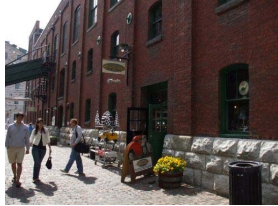
<レンガの建物が並ぶトロントの街並み>